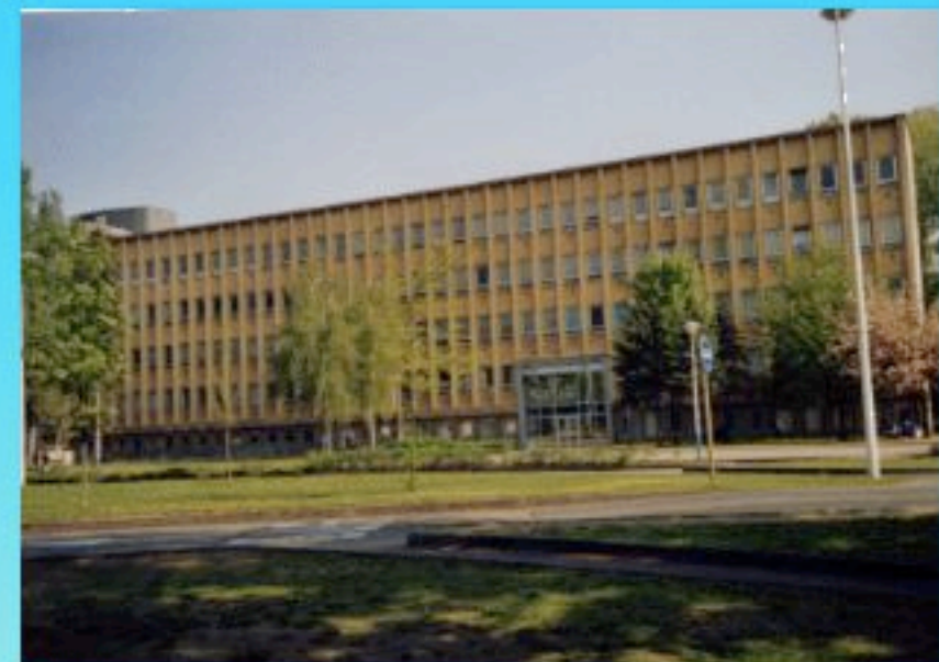
Bâtiment des Sciences