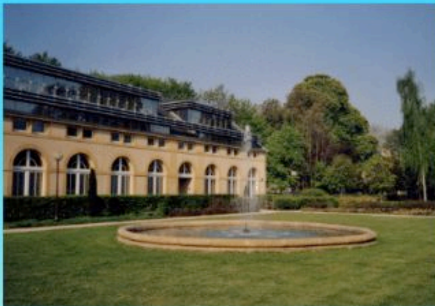
Département de Mathématiques LMAM